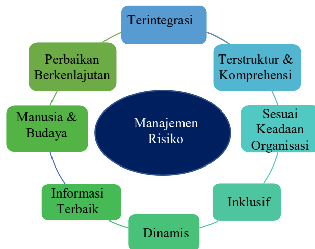
Gambar 1. Prinsip Manajemen Risiko