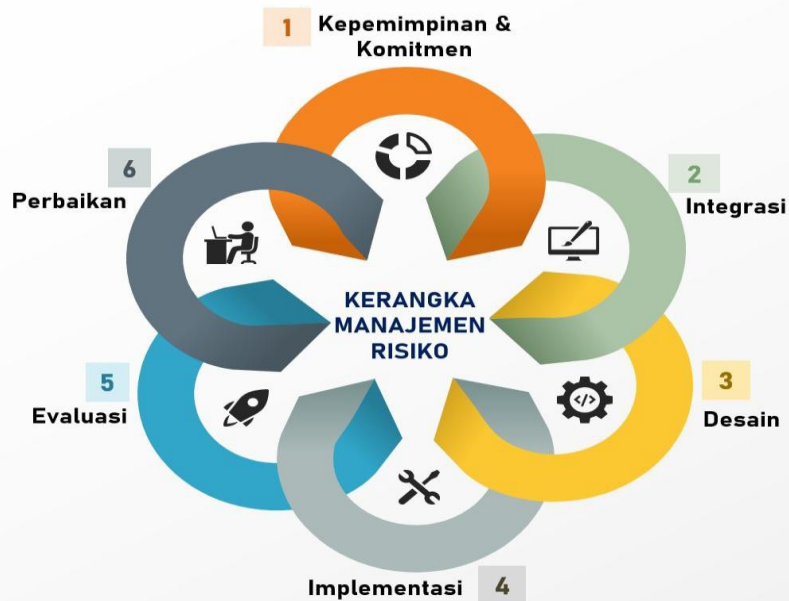
Gambar 2. Kerangka Manajemen Risiko