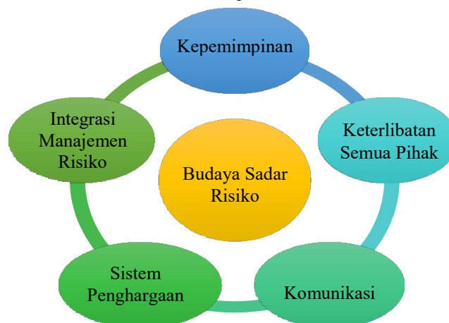
Gambar 3. Budaya Sadar Risiko