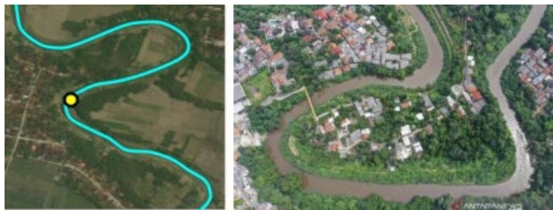
Gambar Sungai Brantas (Jawa Timur)

Bentuk geometri garis sebagai representasi unsur rupabumi yang memiliki bentuk memanjang seperti Jalan, Sungai, Rel Kereta, Terowongan.