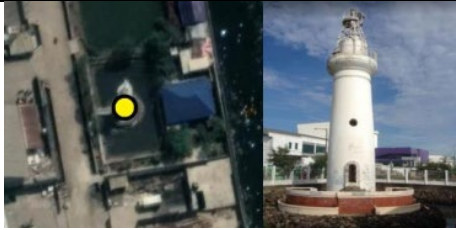
Gambar Mercusuar Sunda Kelapa (Kota Jakarta Utara)

Bentuk geometri titik sebagai representasi unsur rupabumi yang batas kawasannya tidak/belum jelas diantaranya seperti kampung, cagar alam, taman nasional, hutan, dan sebagainya.