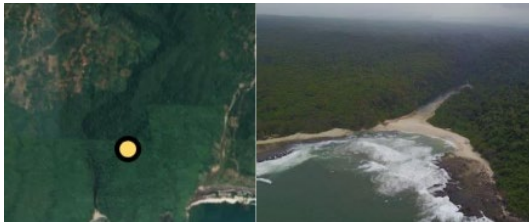
Gambar Cagar Alam Leuweung Sancang (Kab. Garut)

Bentuk geometri titik sebagai representasi unsur rupabumi yang batas kawasannya tidak/belum jelas diantaranya seperti kampung, cagar alam, taman nasional, hutan, dan sebagainya.